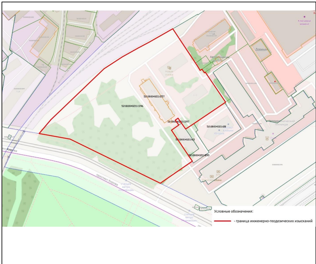
Схема границ подготовки инженерных изысканий

Представитель ООО «АЗ «НАЗ» по доверенности от 06.06.2024 г.